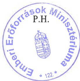
Kiss Szabolcs főosztályvezető

Az Emberi Erőforrások Minisztériuma Szervezeti és Működési Szabályzatáról szóló 16/2018. (VII. 26.) EMMI utasítás 1. melléklet 3. § (8) bekezdése, valamint a 6. függelék IV. Kulturális ágazat cím A) pont 4. alpontja alapján az emberi erőforrások minisztere nevében eljárva: