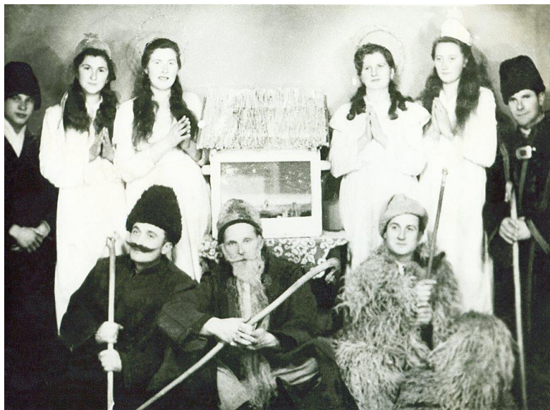
Marcali betlehemesek (1926)

Az egyik legismertebb köszöntő szokás a betlehemezés. Ebben a pásztorjátékban a lányok az angyalokat, a legények a pásztorokat jelenítették meg.