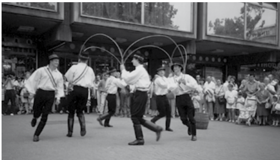
8. kép. „Szüreti felvonulás”, a Vasas Együttes műsora a budapesti Vörösmarty téren 1993-ban

kolci Avas Táncegyüttes vezetésére, amit 1974-ben elvállaltam. Közben asszisztens és táncos voltam a Bihariban, főmérnöki főállás mellett, majd a minőségi munka érdekében abbahagytam az amatőr néptáncolást a Bihar Együttesben.