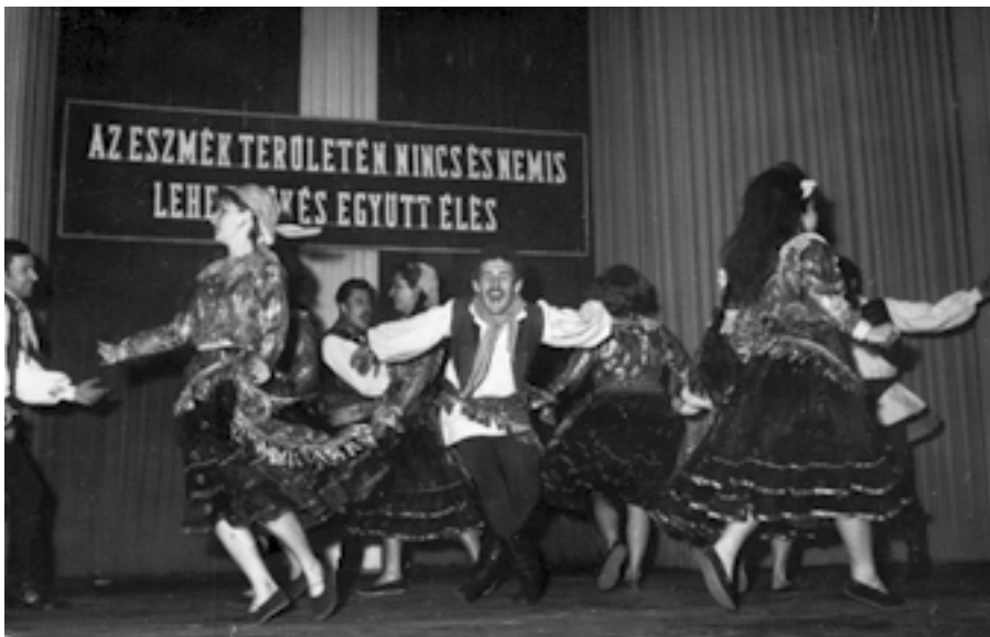
2. kép. A „Közgáz” együttes táncosaként az 1960-as évek elején

1958-ban kezdtem táncolni a Közgazdaságtudományi Egyetem tánccsoportjában. Én még csak akkor kezdtem a középiskolát, tehát nem egyetemistaként kerültem oda. A középiskola után is a Budapesti Műszaki Egyetemre mentem tanulni, de olyan sokat tartózkodtam a tánc miatt a „Közgáz”on, hogy sokan azt