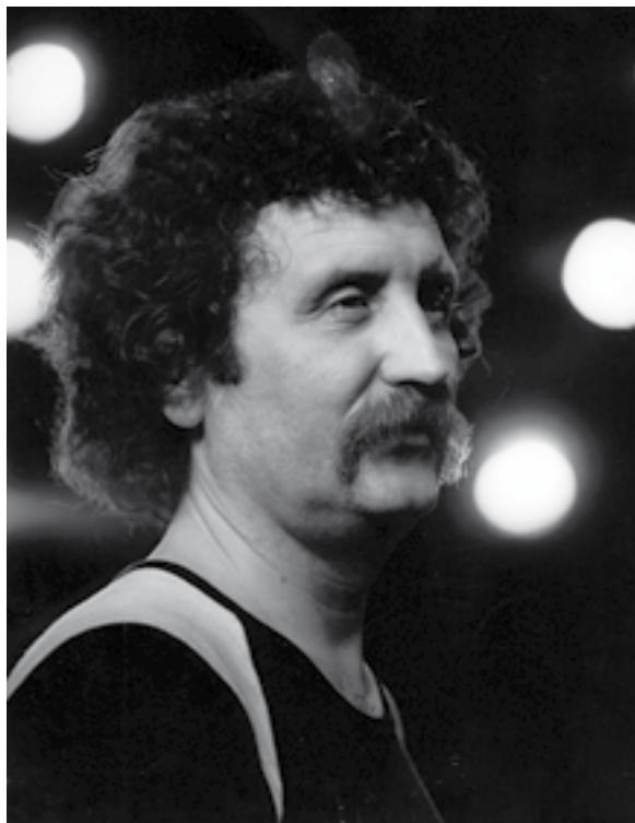
5. kép. A Vasas Táncegyüttes művészeti vezetőjeként az 1980-as évek elején