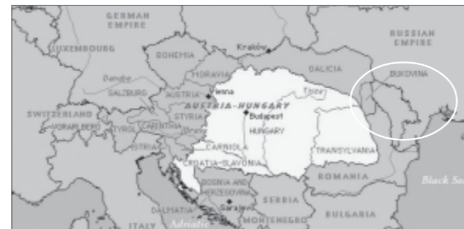
De Oostenrijks-Hongaarse Monarchie: Oostenrijk donkergrijs, Hongarije wit