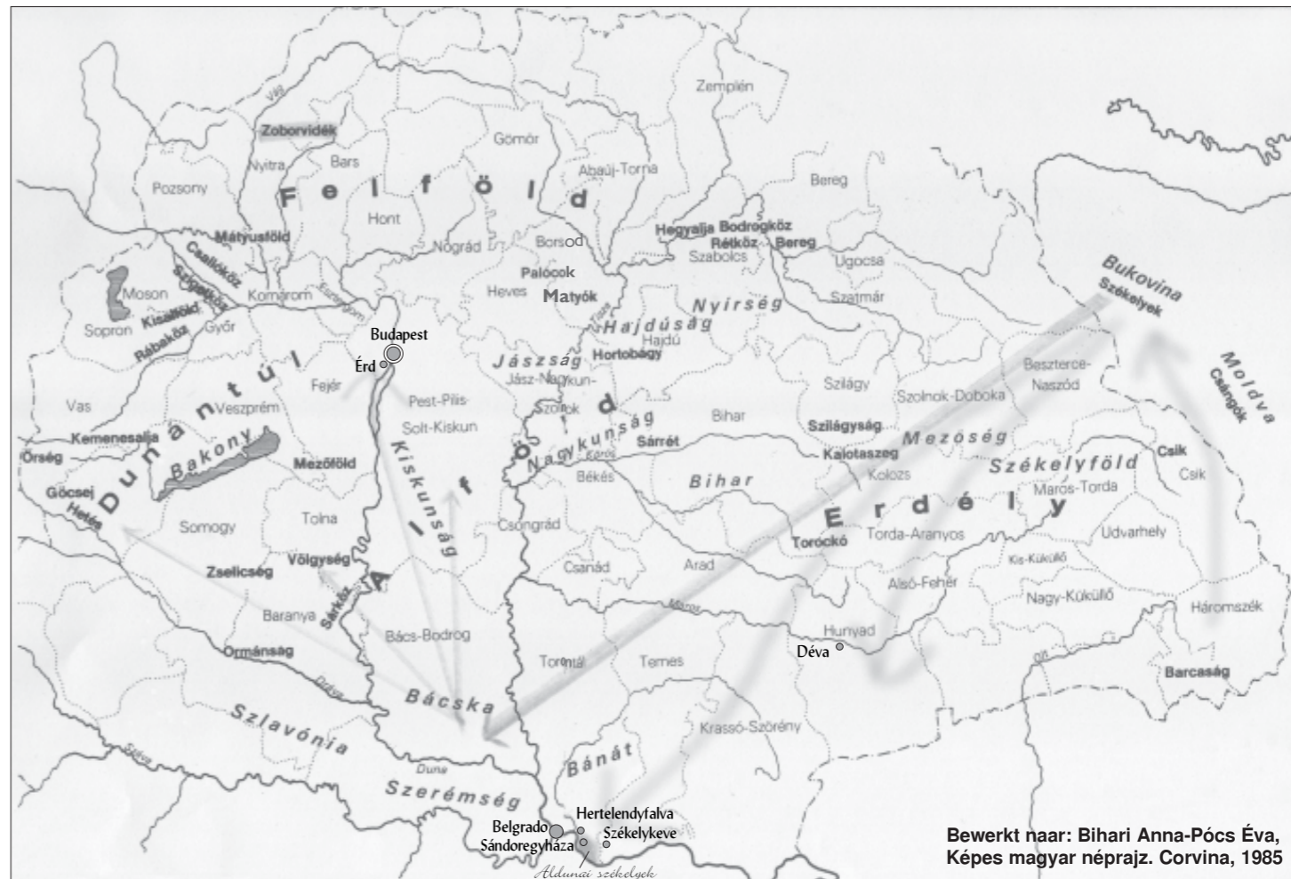
Bewerkt naar: Bihari Anna-Pócs Éva, Képes magyar néprajz. Corvina, 1985

Deze reorganisatie en recrutering ging gepaard met grof geweld, waarbij geen enkele rekening werd gehouden met de aloude vrije rechten van de Szeklers. Aanvankelijk was er veel weerstand onder de bevolking en er brak in december 1763 een gewapende opstand uit.