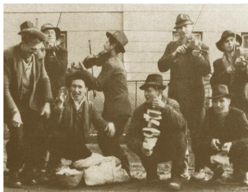
Farsangi adománygyűjtők Sajónémeti

Számtalan szokás kapcsolódik még farsang időszakához, amelyek többsége „farsang farkára”, azaz farsangvasárnapra, farsanghétfőre és húshagyókeddre összpontosult. Ebben az időszakban gyakoriak voltak az álarcos, jelmezes alakoskodások. A farsangi köszöntők gyakran bekormozott arccal, nyárssal a kezükben jártak házról házra és a jókívánságokért cserébe szalonnát kaptak. Ha lányok jártak köszönteni, tojást gyűjtöttek.