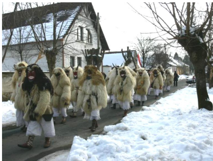
Busók felvonulása Mohácson